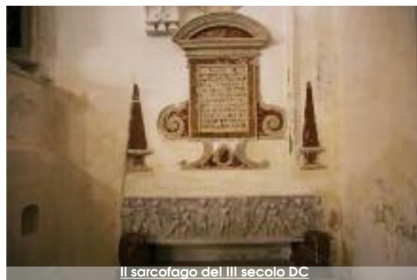
Il sarcofago del III secolo DC

mare. Con il punto più alto dominato dalla chiesa dell'Ascensione, poi intitolata a San Nicola. Nel promontorio dove, da venerdì 9 a sabato 11 novembre, toneranno dame e cavalieri per la rievocazione storica "Manfredi di Trinacria". Un tuffo nel passato che con-