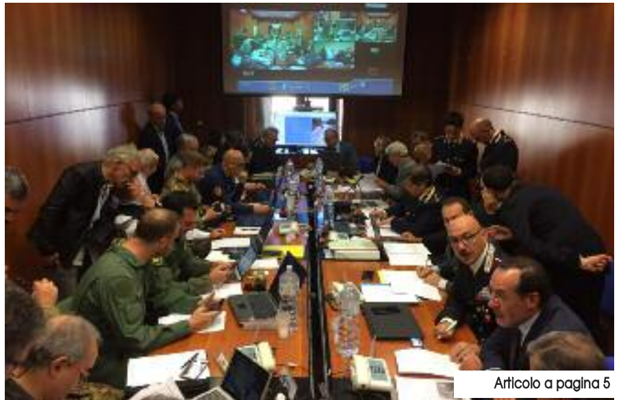
Articolo a pagina 5