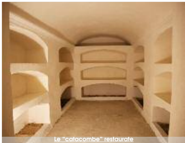
Le "catacombe" restaurate

Un week-end da non perdere assolutamente