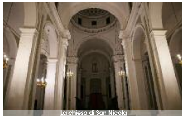
La chiesa di San Nicola

La basilica di San Nicola, con le sue "catacombe" e tutti gli altri "tesori" custoditi al suo interno, rappresenta uno dei "ponti" in grado di farci tornare indietro nel tempo di parecchi secoli. Sicuramente al III secolo d.C., periodo a cui risale il sarcofago, dell'epoca imperiale Romana, che si trova in una delle pareti della chiesa. Proprio sotto il grande Crocifisso con ai lati i due ladroni. Insomma, è davvero una delle chiese più belle e ricche di storia di Trapani, in quella parte del centro storico della città che un tempo veniva chiamato "quartiere di mezzo". Tra le porte di Levante e Ponente. Quando il centro abitato era circondato da mura su un'isolotto completamente circondato dal